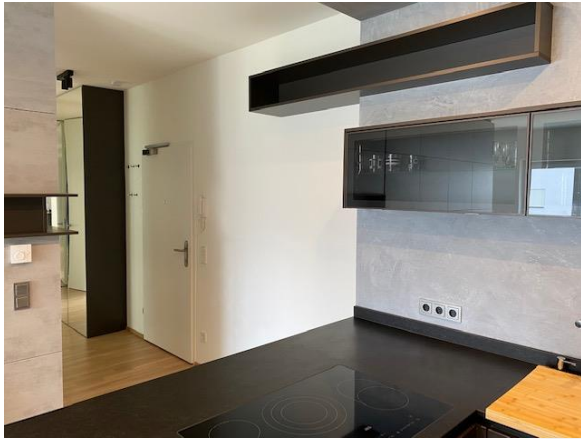
Küche Richtung Eingangsbereich