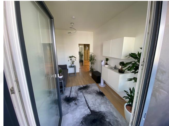
Schlafzimmer 1 Blick von der Loggia