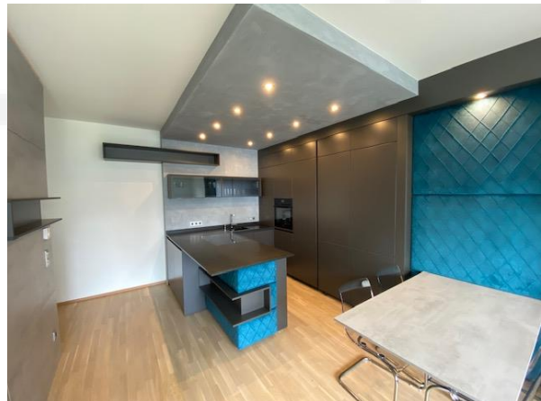
Wohnzimmer mit topmoderner Küche