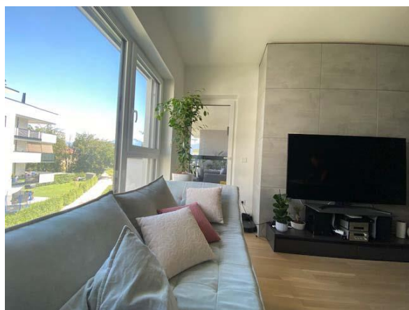
Wohnzimmer Richtung Loggia